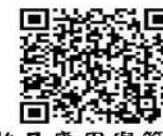
化妝品應用與管理科